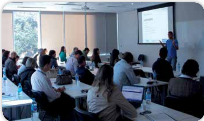
Participantes na escola técnica de Alvenaria.

Devido à importância e relevância do tema, serão realizadas novas turmas ao longo de 2018, abordando o assunto de forma conceitual e aplicação no cenário do Grupo HTB, agregando valor às atividades desempenhadas pelos colaboradores.