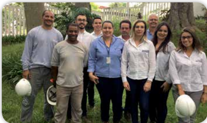
Equipe da obra.

A TEDESCO está certa de que esta obra será de grande importância para o Grupo HTB e contribuirá para nossa expertise nesta tipologia de projeto.