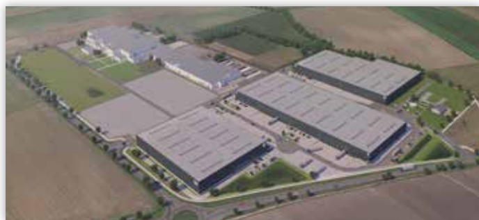
Perspectiva do empreendimento “Industrial Campus Vienna East”.