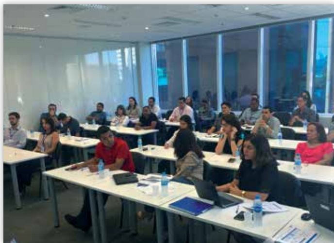
Participantes do Workshop Suprimentos.

A unidade de serviço suprimentos realizou o Workshop de Suprimentos, no escritório de São Paulo, no qual participaram aproximadamente 50 colaboradores.