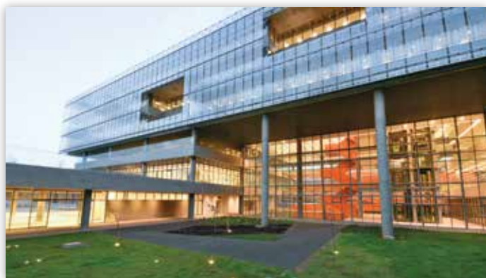
Empreendimento Natura SP.