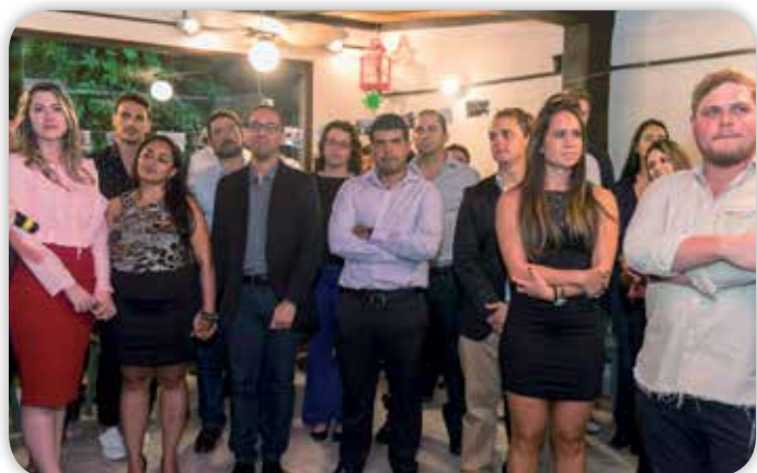
Turma do Programa Jovens Profissionais, durante o evento.

No percurso dessa trajetória, foi exigido de cada jovem muito empenho e aplicação, pois tiveram que conciliar a demanda do trabalho diário, com as atividades exigidas pelo programa.