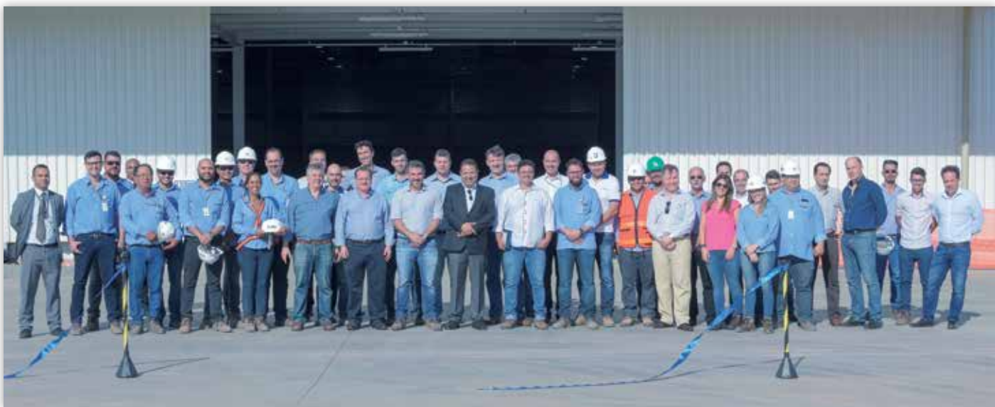
Evento de inauguração do empreendimento.