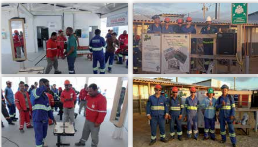
Campanha na UN Yara - Projeto RGC.

Na UN Yara - Projeto RGC o resultado do empenho da equipe favoreceu a realização da campanha denominada "1 Milhão de Horas Trabalhadas sem Acidentes com Afastamento".