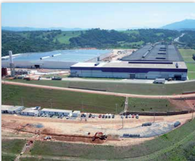
Vista aérea do empreendimento.

A KERN entregou ao cliente VBI Real Estate, gestora de fundos de private equity focada no setor imobiliário, a fase 1 e está em finalização, a fase 2 do galpão 20, localizado em Extrema, Minas Gerais.