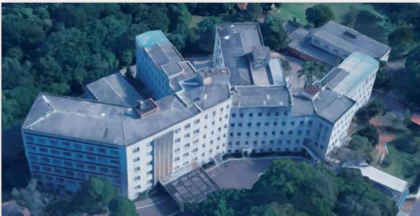
Vista aérea do empreendimento.