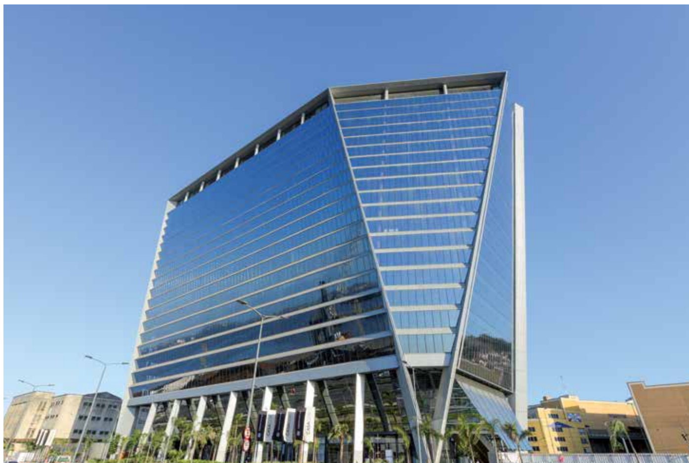
Vista do empreendimento.