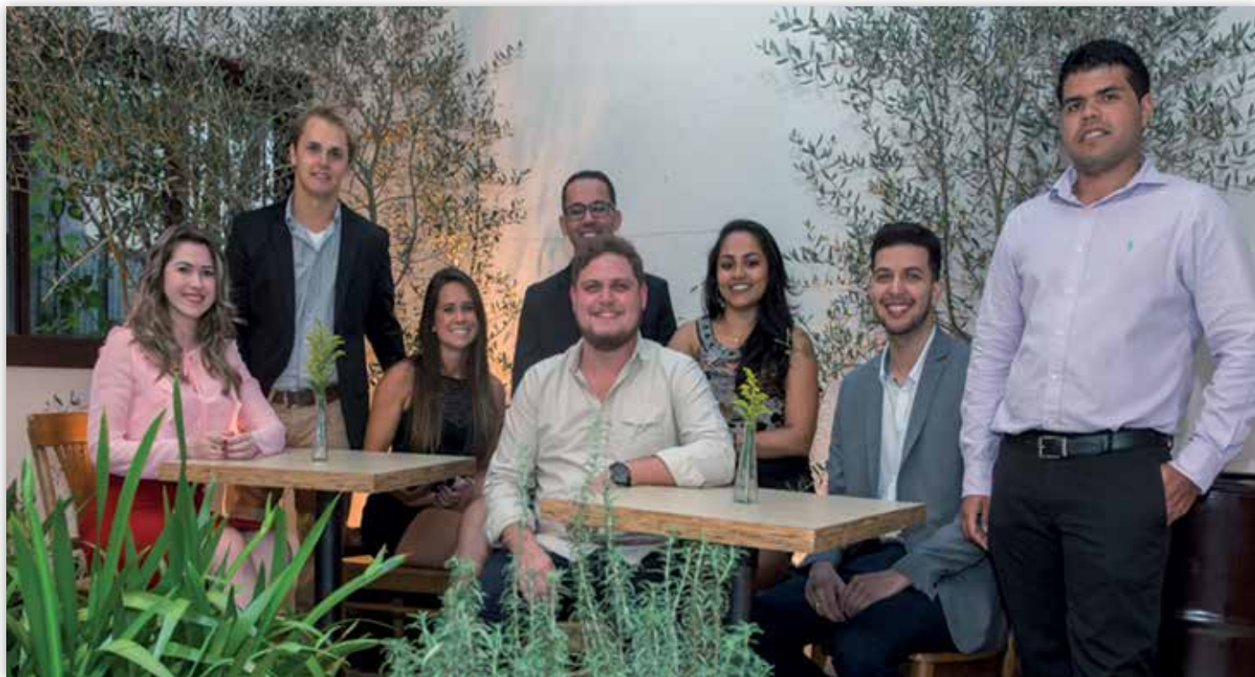
Turma Jovens Profissionais.

Em clima de festa e descontração foi realizado o encerramento de mais uma edição do Programa de Jovens Profissionais. Após o período de quase dois anos de empenho. Foi realizado o coquetel de comemoração dessa importante trajetória percorrida pelos oito participantes, que contou com a presença de familiares, amigos, mentores e da alta liderança do Grupo HTB.