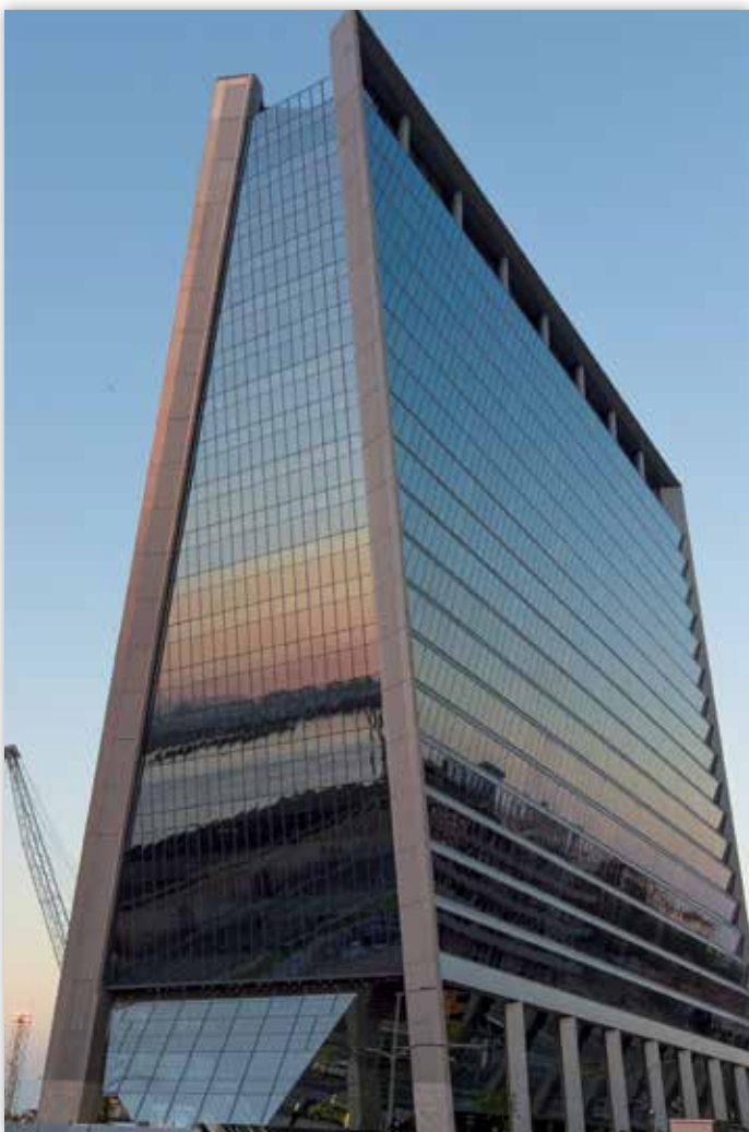
Vista do empreendimento.

O empreendimento AQWA Corporate (Tishman - Pátio da Marítima) foi construído para a Tishman Speyer, que já foi cliente da HTB na construção do edifício Faria Lima 3500, em São Paulo.