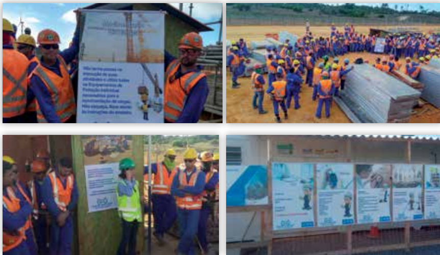
Campanha na UN UTE Porto de Sergipe I.

Na UN Yara - Projeto RGC o resultado do empenho da equipe favoreceu a realização da campanha denominada "1 Milhão de Horas Trabalhadas sem Acidentes com Afastamento".