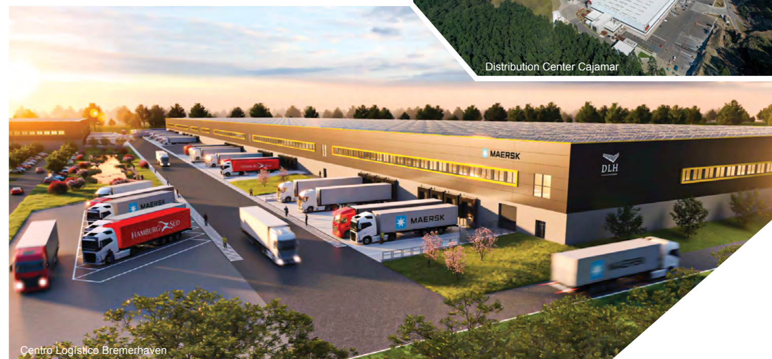
Centro Logístico Bremerhaven