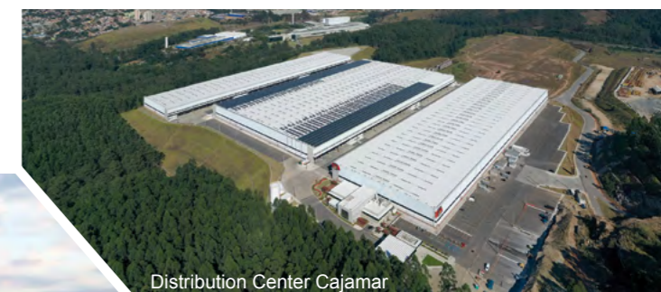
Distribution Center Cajamar

No Grupo HTB, entregamos recentemente os projetos Distribution Center Cajamar para a GTIS, e o BRPR Cajamar I, para a BR Properties, que seguem os mesmos padrões de sustentabilidade do Centro Logístico Bremerhaven. Localizados em uma das principais rotas logísticas de São Paulo, os empreendimentos foram executados seguindo os mais rigorosos requisitos de qualidade para receber as certificações LEED Platinum e Gold respectivamente.